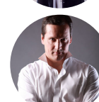
Nikolaj Pronin basso